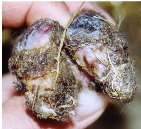
Moderhinke bei einem Lamm

Moderhinke wird durch Dichelobacter nodosus hervorgerufen. Der Erreger überlebt auf der Weide etwa 10 bis 14 Tage, in infiziertem Klauenhorn jedoch Monate bis Jahre. Die natürliche Infektion führt zu keiner Bildung von Antikörpern. Deshalb kann der Impfstoff sowohl prophylaktisch als auch therapeutisch eingesetzt werden. Da der Impfschutz nur ein knappes halbes Jahr anhält, empfiehlt es sich die Impfung etwa 4 bis 6 Wochen vor Risikoperioden (feuchtwarmes Wetter) durchzuführen.