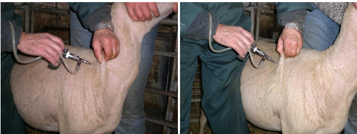
Sinnvolle Applikationsorte beim Schaf; genauso für die Ziege möglich

Bei der Entnahme ist zu beachten, dass eine sterile Kanüle in der Impfstoffflasche verbleibt um Kontaminationen zu vermeiden. Die Weiterverwendung angebrochener Flaschen ist mit Risiken behaftet. Neben möglichen Kontaminationen kann ein vergrößerter Luftraum zu Oxidationsschäden des Antigens oder Trägerstoffs führen. Auch Temperaturschwankungen können Beeinträchtigungen hervorrufen.